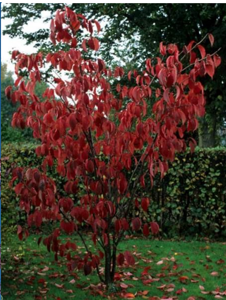
Vår- och Höstfärger!