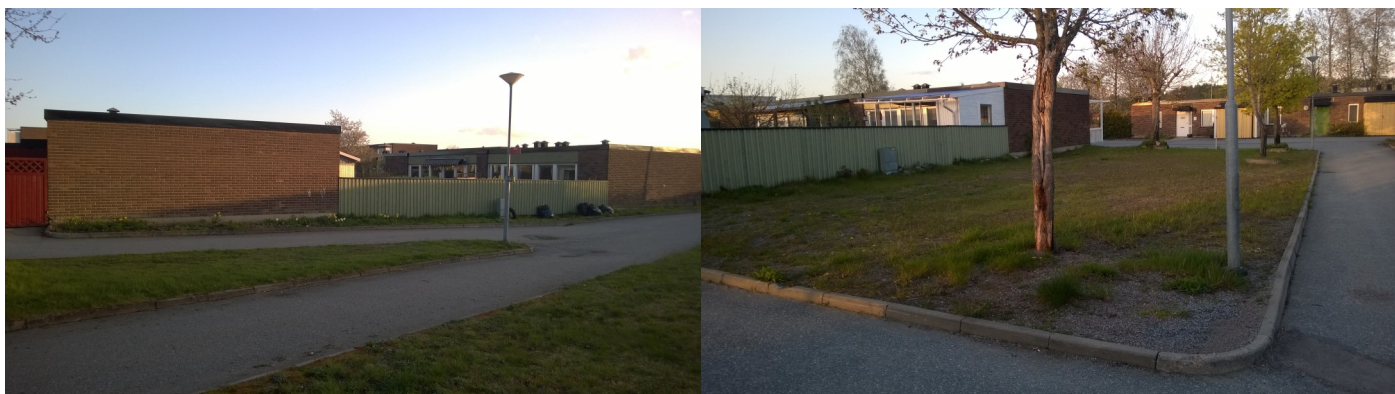
Det gäller rabatten på Vallmostigen och grusytan på Liljestigen.

Det blir en del stora maskiner i området och vi ber om ursäkt för det besvär som kan uppstå men hoppas på er förståelse.